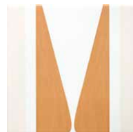
Pick Rene 15x15 Brillo - 23932