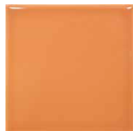
Pick Marmalade 15x15 Brillo - 23849