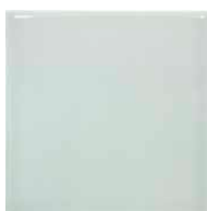
Pick Pistachio 15x15 Brillo - 23847