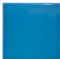
Pick Blueberry 15x15 Brillo - 23850