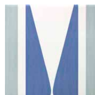
Pick Vogue 15x15 Brillo - 23931